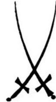
Bildmarke Staatliche Porzellanmanufaktur Meissen (1875)